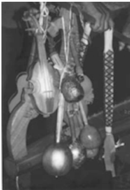
Figura 1. Los instrumentos.

es un cordófono de cuerda frotada con tres órdenes de cuerdas sencillas, y fue adoptado en la Nueva España para la liturgia católica (Contreras, 1988; Ricard, 2000; Rouvina, 1999). 4 El cartonal, también denominado cardonal, es un pequeño cordófono de cuerda rasgueada generalmente con tres órdenes de cuerdas sencillas. 5