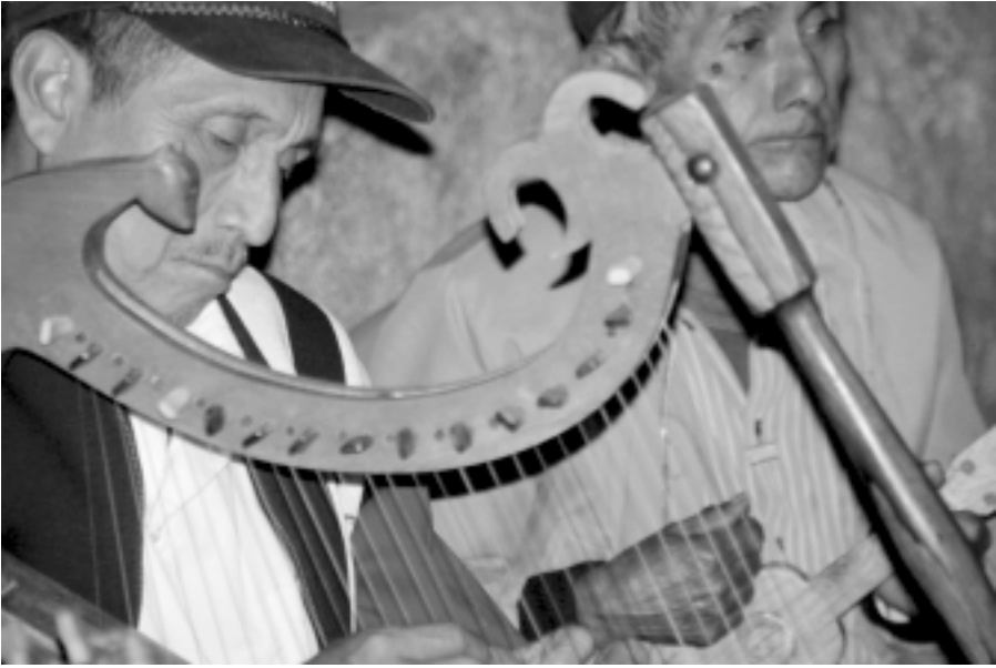
Figura 5. Serpiente y tecolote en el clavijero del arpa.

siembra u obtención del maíz. Con dicho agradecimiento se espera sortear algún daño. Por otra parte, el mismo músico comentó que el mencionado reptil se relaciona con la danza porque posee un cascabel en la cola, del mismo modo que los danzantes llevan uno en la mano. Cuando la serpiente hace sonar su cascabel atrae las lluvias, así como los danzantes hacen posible que llueva al emular el sonido mediante el sacudimiento de estos idiófonos.