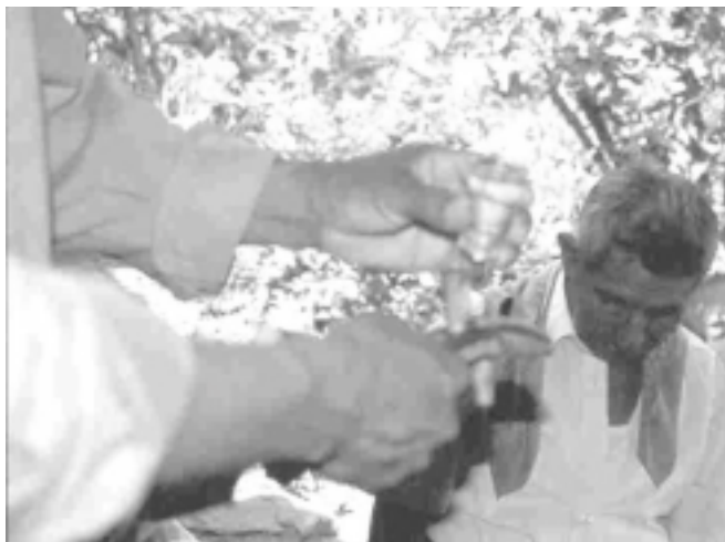
Figura 4. Dando aguardiente al rabelito.

cubiertos por una servilleta. Mientras se ejecuta “La comida de los dioses” ( teyomejtlacuas ), se da de comer a dos, siete o catorce niños que representan a los “diositos”, entidades espirituales también denominadas teyotzitzin . Después se invita a todos los participantes a probar la comida ritual, incluyendo a los músicos y danzantes quienes, al terminar el primer grupo de siete sones, toman un descanso. Acabando de comer, se inciencan los instrumentos e inicia otro ciclo de siete sones, tocando primero uno de “Agradecimiento para la comida” ( tlacuastlaxcamatili ). Hay sones vinculados más directamente con el entorno natural-sobrenatural-cultural que se llaman “El huarache,” “La nube,” “La chuparrosa,” “La araña del agua,” o el “Son para cortar aguacates”. El orden de este tipo de piezas puede variar según el evento ritual. 12 Los últimos dos, según se ha podido observar, corresponden a “El último son” y “La despedida”. “El último son” suele ser en realidad el penúltimo de la ceremonia; marca la desacralización del espacio ritual y prepara para la despedida, acompañado por la pieza denominada precisamente “La despedida”. Es importante que la música se ejecute de