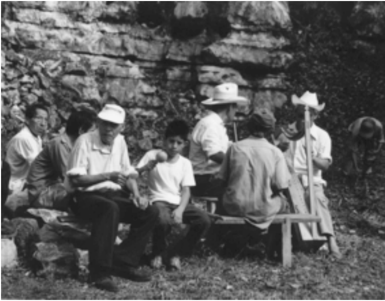
Figura 2. Músicos del Ayacaxtini de Ixtacamel.